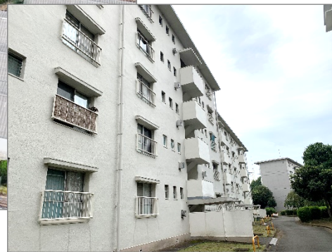
※築53年を迎えた小川住宅