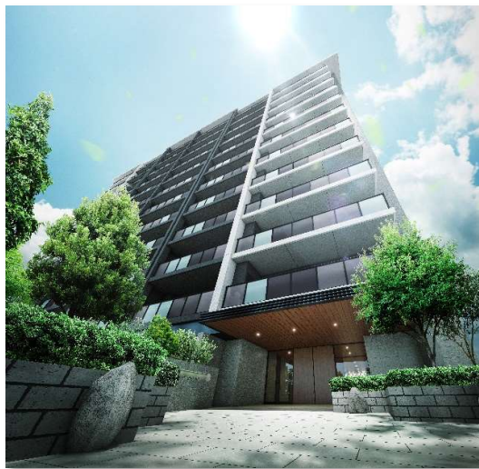
エントランスアプローチ完成予想 CG

豊かな植栽に導かれるエントランスアプローチや、優雅な折上げ天井と木調の棚が美しい上質なエントランスラウンジを造り上げました。エントランスラウンジの先には四季折々の緑に包まれたテラスを設え、世代を超えて人が集まり、共に安らぐ共用空間を目指しました。