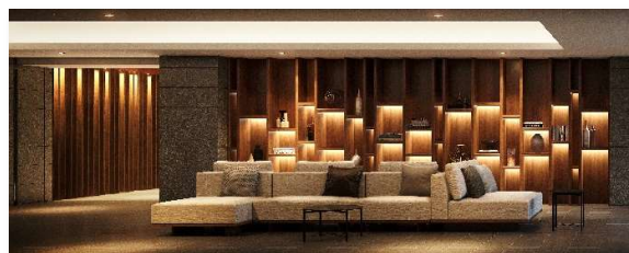
エントランスラウンジ完成予想 CG