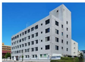
国分中央病院 (徒歩 6分)