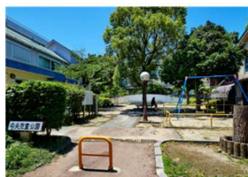
中央児童公園 (徒歩 4分)