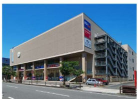
きりしま国分山形屋 (徒歩 2分)