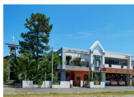
カトリック国分幼稚園 (徒歩 1分)