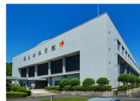
国分中央病院 (徒歩 6分)