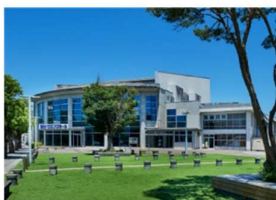
国分ハウジングホール (霧島市民会館) (徒歩 4分)