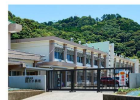
国分小学校 (徒歩 11分)