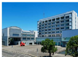
霧島市役所 (徒歩 6分)