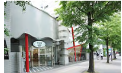
令和元年 和太鼓スクール HIBIKUS 天神開設