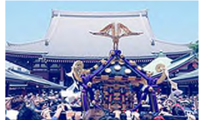
平成 8 年 浅草神社御本社神輿（三基）平成大修復