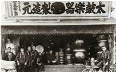
大正 15 年 大正天皇御大葬用楽器一式謹製