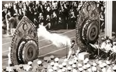
昭和 39 年 東京オリンピック開会式の大火焰太鼓謹製