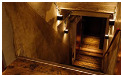
平成 29 年 HIBIKUS 浅草 Basement 開設