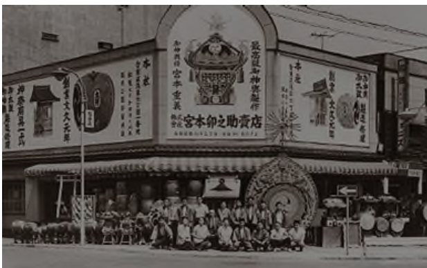
昭和23年 宮本卯之助商店 現西浅草店のオープン時の写真