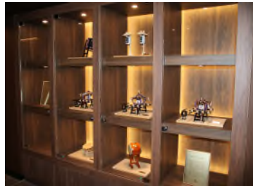
エレベーターホールミニ製品展示